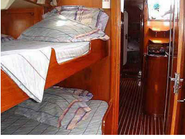
Die S.Y. Scorpio